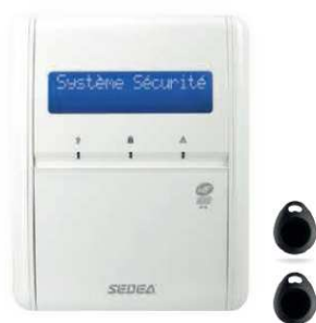
Clavier LCD / lecteur de badge