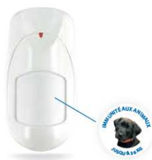
Détecteur de mouvement